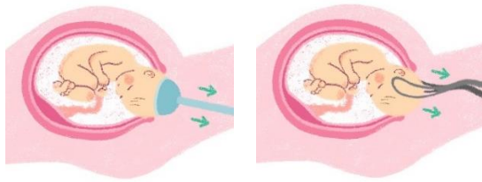
きゆういんぶんべん 吸引分娩