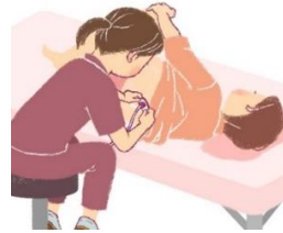
роды с анестезией