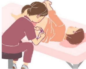
むつうぶんべん 無痛分娩